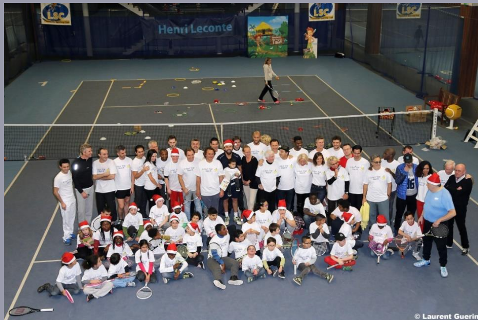
Sourire Gagnant au LSCT